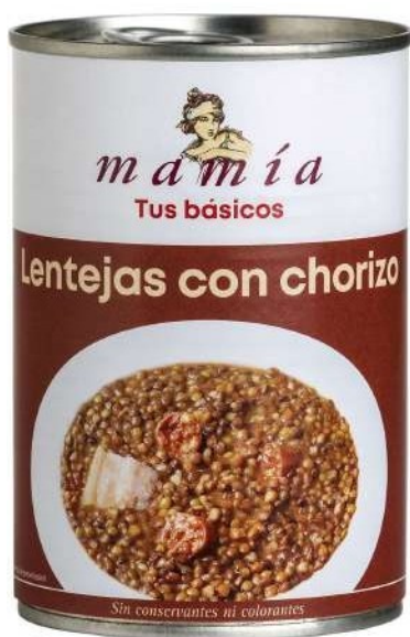
LENTEJAS CON CHORIZO Ref. 1854 Lata 425 ml Peso neto 400 g