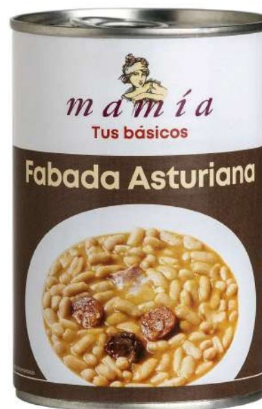
FABADA ASTURIANA Ref. 1850 Lata 425 ml Peso neto 425 g